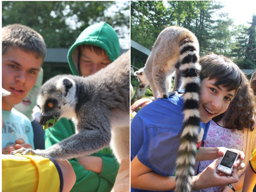
In der Affenwelt

Am Vormittag durften wir hautnah in der Affenwelt unterschiedliche Primatenarten kennen lernen und erleben. Danach erkundeten wir die Fahrgeschäfte des Serengeti-Parks und daran anschließend erklommen die Mutigen unter uns den Hochseilgarten.